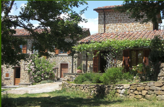
Das Gästehaus des Casa del Vento liegt direkt neben dem Haupthaus. Es hat 4 Ausgänge und zwei Terrassen. Von der oberen Schlafraumterrasse geht man durch ein eigenes Tor hinaus in die freie Landschaft ...