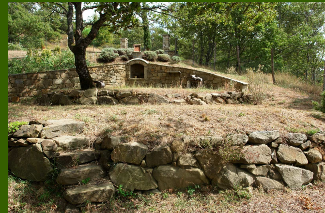
unser Zeltplatz mit Feuerstelle und Außendusche