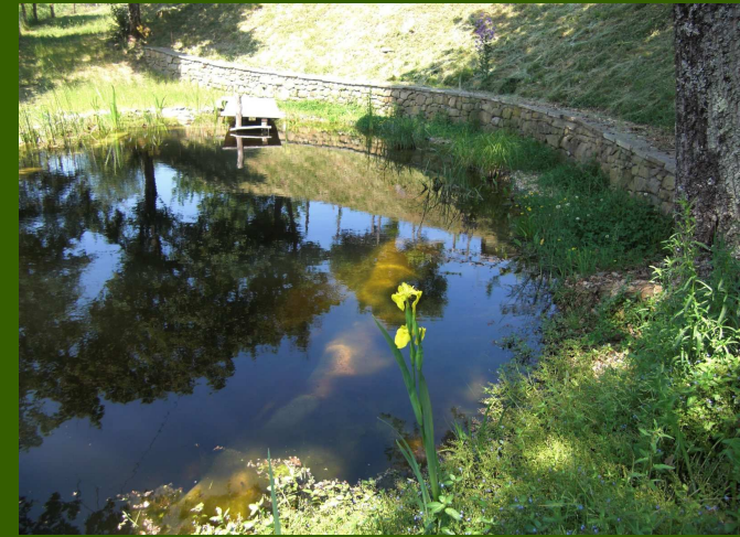
Schwimmteich mit Steg