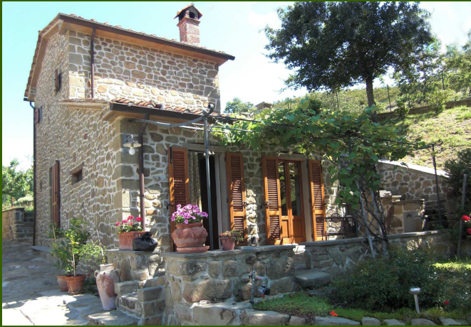
Gästehaus mit 2 Räumen, 2 Terrassen, Küche und Bad