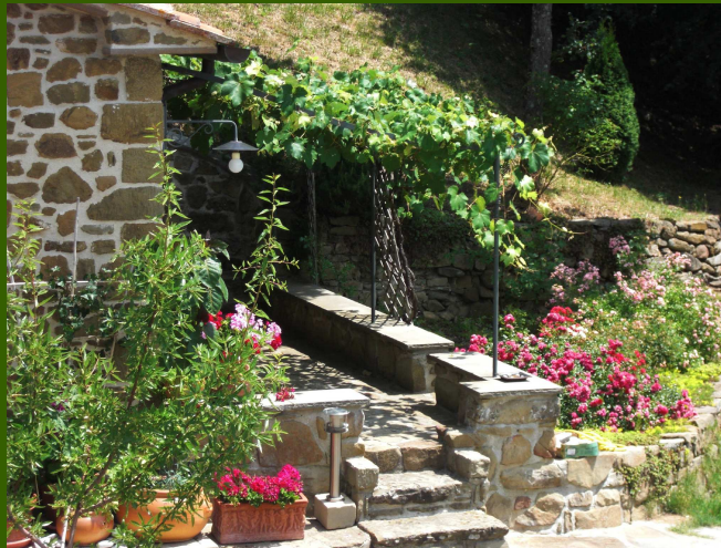
Mittagsterrasse unter Weinlaub