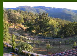
Blick in die weite und stille Landschaft