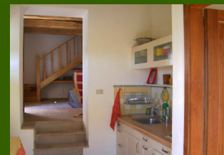
kleine Küche mit Terrasse