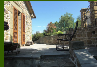
Schlafraum mit Morgenterrasse